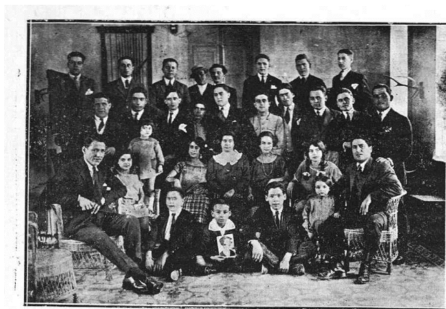
ECIJA.— Agrupación artística que organiza brillantes representaciones teatrales en el Casino de los Artesanos