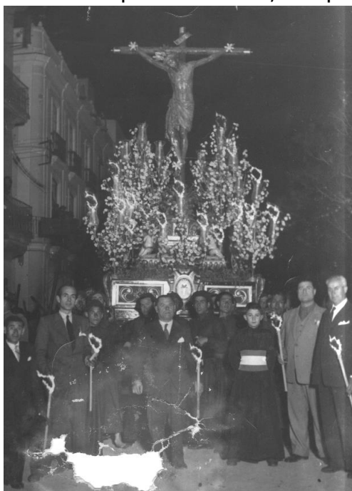
Imagen del Cristo y Señor de la Sangre al culto en el convento agustino, concretamente el 26 de Enero del año de 1605, sale por primera vez en procesión de rogativas hasta la Iglesia de Santa María, por la falta de agua de lluvia que padecía la Ciudad. La devoción que se le tenía al Cristo de la Sangre y la importancia de su Hermandad y Cofradía, quedó recogida por los escritos de la época. Dicen algunas reseñas de los años 1600 y posteriores:

Una prueba de ello, es que cuando eran pocos los años que llevaba la