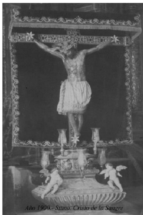
Año 1900.- Stmo. Cristo de la Sangre

El 4 de octubre de 1592 recibe el encargo de realizar una escultura de la imagen de San Sebastián, con su tabernáculo, para la capilla del jurado Sebastián Pérez en la Parroquia de San Pedro de Carmona por el precio de 800 reales; en 14 de mayo de 1593, para la cofradía de San Felipe en Carmona, se le encarga una imagen de dicho santo y parihuelas, suscribiéndose contrato con el regidor Juan de Mendoza, prioste de dicha cofradía, en el precio de 40 ducados