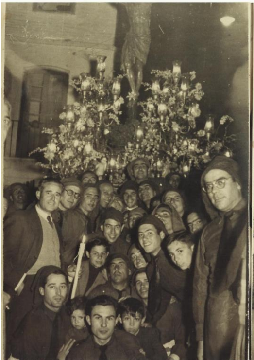
Imagen de Cristo crucificado en su advocación de la Sangre. Allí aprendí como se le habla de tú a Tú, sin intermediarios y sin necesidad de anunciarle su visita. Él siempre tenía sus puertas abiertas, con sus brazos extendidos para recoger las súplicas, ruegos y peticiones.

El barrio donde viví hasta mi adolescencia, sin menospreciar a ningún otro, podría parecer igual a los demás, pero yo sabía que era distinto, diferente, repleto de idiosincrasias personales y algunas peculiaridades especiales. Allí aprendí, desde muy niño, lo que era la fe y el fervor a una