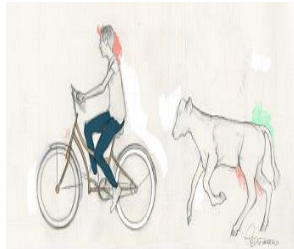
Bajo las encinas